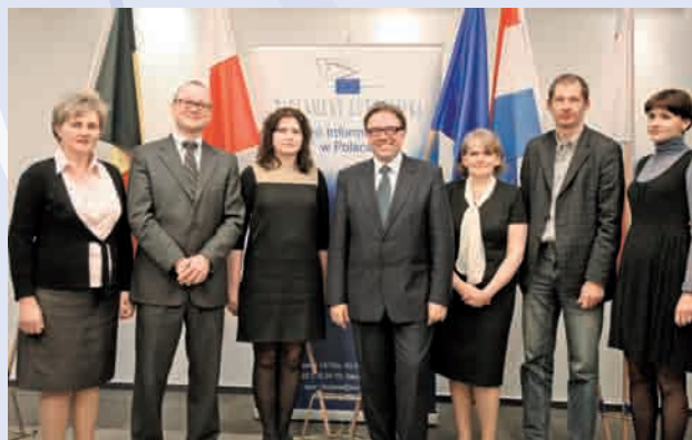
Zespół Biura Informacyjnego Parlamentu Europejskiego