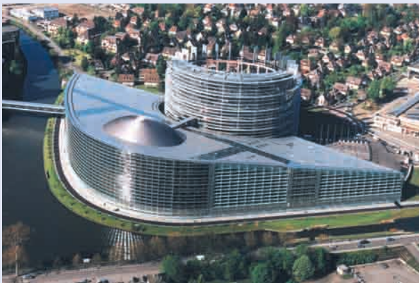
Budynek Parlamentu Europejskiego w Strasburgu

Parlament Europejski ustanawia prawa, które mają wpływ na życie codzienne każdego obywatela Unii.