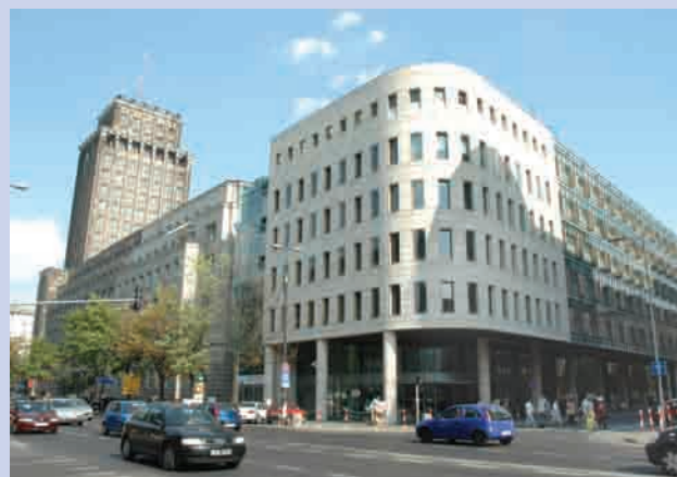
Budynek w którym mieści się BIPE i Punkt Informacyjny UE