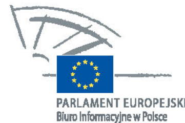
PARLAMENT EUROPEJSKI Biuro Informacyjne w Polsce