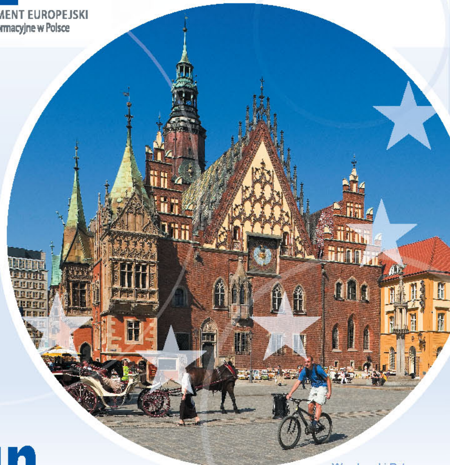
Wrocławski Ratusz