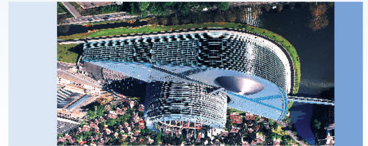
BUDYNEK PARLAMENTU EUROPEJSKIEGO W STRASBURGU

Wybierany co pięć lat Parlament Europejski ustanawia prawa, które mają wpływ na życie codzienne każdego obywatela Unii.